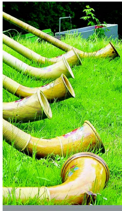
Wenn im Freien geübt wird ...

Alphornkonzert übermorgen Samstag, 17. September, 20 Uhr, im Bienkensaal in Oensingen. Der Anlass gehört zur Konzertreihe «Alphorn in concert»